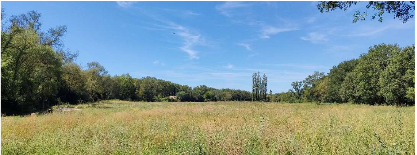
PRAIRIES ALLUVIALES DE LAVÉRUNE

Les cartes pourront faire l'objet d'une édition et/ou déclinaison en exposition itinérante appropriable par différents acteurs locaux.