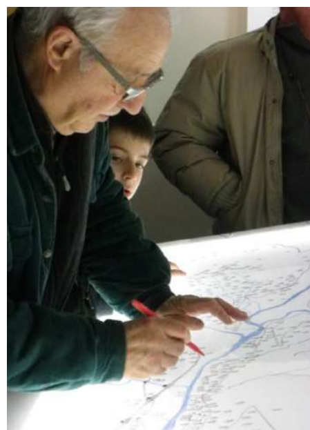
EXEMPLES DE CARTOGRAPHIES ET ATELIERS REALISES PAR JULIEN RODRIGUEZ ©